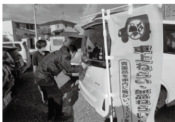
老人介護施設(株)サンケア(稲沢)での活動