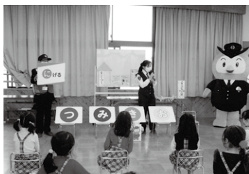
矢作白鳥幼稚園(岡崎)でのお話し会